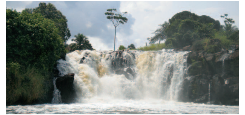
Above: Lobe Falls is one of few rivers that dramatically reaches the ocean by waterfall

La route périphérique offre des vues panoramiques sur 360 km traversant les Grassfields camerounais et relie toutes les villes principales de la province du nord-ouest. Vous pouvez effectuer ce périple en 4x4, en bus ou même à bicyclette : 80 pour cent du trajet s'effectue sur des chemins de terre qui traversent des villages dirigés par des Fons (chefs locaux).